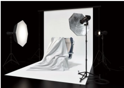
Equinox – Weltpremiere eines neuen Premiumclass-Sitzstandards

Weltpremiere: Der neue Bahnsessel EQUINOX ist die Antwort auf stetig steigende Anforderungen und Bedürfnisse des globalen Bahnmarkts. Er erfüllt höchste Standards in Bezug auf Innovation sowie Funktionalität und ist vor allem für Wagen des Premium-Segments bestimmt. Bei der Herstellung wurden neueste Konstruktions- und Materiallösungen angewandt, was zu einer bedeutenden Gewichtsreduktion geführt hat. Zugleich werden höchste ästhetische und qualitative Standards in Bezug auf Ergonomie, Beanspruchbarkeit und restriktive Brandschutznormen eingehalten. Die angewandte Technologie ermöglicht verschiedene Sesselkonfigurationen und die modulare sowie universelle Konstruktionsweise sorgt dafür, dass der Sessel beliebig modifiziert und voll an individuelle Kundenbedürfnisse angepasst werden kann.