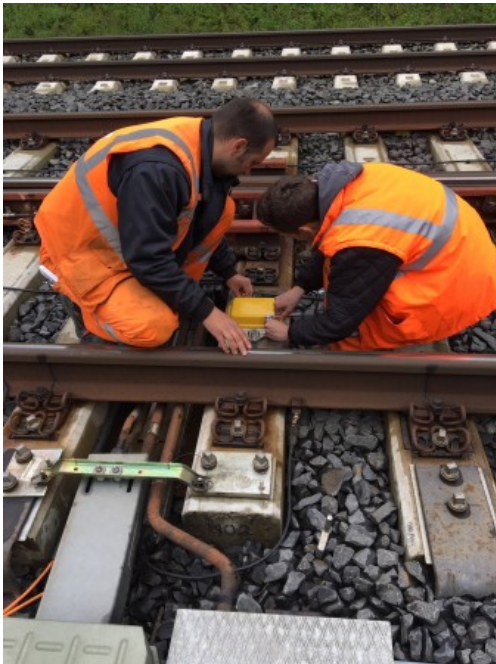
LAT-Monteur installieren Sensortechnik im Gleisbett

Mit einem neuen Innovationsservice unterstützt die LAT Fernmelde-Montagen und Tiefbau GmbH Tech Start-ups bei Testinstallationen, in der Roll-Out Phase und in der Wartung. Das Berliner Familienunternehmen mit 50 Jahren Erfahrung in der Verkehrswirtschaft schafft dabei den Spagat zwischen Traditionsliebe und Fortschrittseuphorie: Die Monteure sind darauf spezialisiert, industrielle IoT-Lösungen, digitale Messtechnik und intelligente Sensoren im Gleisbett einzubauen. Dabei wird auch „unter rollendem Rad“ gearbeitet. Aktuell wird Sensortechnik für KONUX installiert. Dabei nutzen Poliere digitale Klemmbretter, während Bauleiter Montageleistungen in Echtzeit dokumentieren.