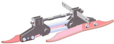
Streckentrenner Save-T (konstruktive Anpassungen vorbehalten)

Das weltweit tätige Unternehmen Arthur Flury AG stellt qualitativ hochwertige elektromechanische Komponenten und Systeme her. Auf der InnoTrans werden gleich zwei neue Produkte für die Straßenbahnoberleitung vorgestellt: Der neue Streckentrenner Save-T ist eine innovative Lösung für 1 kV DC-Systeme. Er kann mit relativ hohen Geschwindigkeiten in beide Richtungen befahren werden, überzeugt durch sein geringes Gewicht sowie die bewährte Arthur Flury Qualität und ist schnell installiert. Eine weitere Produktneuheit basiert auf einer Weiterentwicklung der zuverlässigen Fahrdrabtkreuzung FDX und ist für den flexiblen Einsatz systemspezifisch zwischen 50 ° - 90 ° verstellbar.