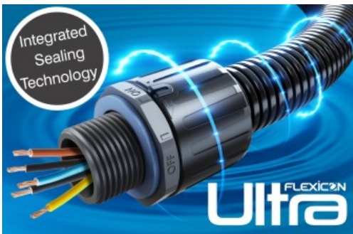
Flexicon ULTRA™: Die weltbeste Schlauchverschraubung

Systemintegrität ist entscheidend für die sichere Funktion im Dauerbetrieb eines Schienenverkehrssystems. Einflussfaktoren wie zu geringe IP-Schutzart, mangelnde dynamische Leistung, starke Schwingungen und ständige Bewegungen oder plötzliche Trägheitswirkung können systemgefährdend wirken. Ultra™ von Flexicon ist eine einteilige Schlauchverschraubung aus Kunststoff, die nach dem „fit-and-forget“-Prinzip ein Höchstmaß an Performance und Zuverlässigkeit bietet. Dank standardmäßig verbauter Dichtungstechnik werden die Schutzarten IP68 (2 bar) und IP69 problemlos erreicht. Zudem gewährleistet Ultra™ eine Zugfestigkeit bis zu 70 kg sowie hervorragenden Schutz gegen Vibration und Schlageinwirkung. Einfach, schnell und zuverlässig wird der Schutzschlauch in die Verschraubung eingerastet. Dank seiner Konstruktionsweise lässt sich das gesamte System mit einem Schraubendreher jederzeit wieder öffnen. Flexicon Ultra™ wird auf der InnoTrans 2018 auf drei Versuchsaufbauten unter dynamischen Belastungen live getestet.