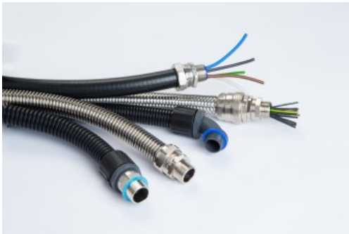
Flexible Schutzschlauchlösungen für Bahntechnik