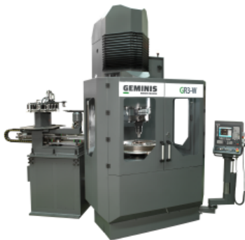
Bohrmaschine GR3-W zur Bearbeitung von Radnaben

Geminis, Handelsmarke des Herstellers Goratu, wird auf der InnoTrans 2018 zum ersten Mal der Fachöffentlichkeit auf einer Messe eine neue Maschine für die Bohrbearbeitung von Radnaben vorstellen. Die Vertikalbohrmaschine GB3-W von Geminis verfügt über die fortschrittlichsten Technologien und besitzt folgende Hauptmerkmale: Spezielle Maschinenkonzipierung für das Bohren von Radnaben, benutzerfreundliche Bedienschnittstelle, automatischer Werkzeugwechsler, integriertes Radbohr-Messsystem, automatische Erstellung von Messberichten und selbstzentrierendes Hydrodehnspannfutter. Die Maschinen von Geminis werden speziell für die Bearbeitung von Achsen, Rädern und Achs-Rad-Einheiten entwickelt. Das Unternehmen besitzt über 60 Jahre Erfahrung bei der Entwicklung von Lösungen für die anspruchsvollsten Bearbeitungsanwendungen und bietet einen weltweiten Kundendienst.