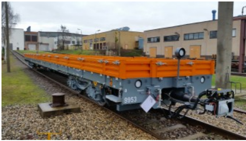
4-achsiger Spezialflachwagen, 21 m

Die Maschinenbau und Service GmbH bietet ganzheitliche Entwicklungs-, Fertigungs- und Servicekompetenz für Fahrzeuge und Produktionsanlagen von morgen. Neueste Produkte der MSG mbH – Waggonbau Ammendorf - sind schienegebundene Arbeitswagen zur Instandhaltung des Streckennetzes der Münchner U-Bahn. Diese wurden eigens von der MSG entwickelt und gefertigt. Zwei dieser Flachwagen werden nunmehr erstmalig auf dem Gleisgelände der InnoTrans 2018 vorgestellt. Der Auftrag der Stadtwerke München umfasst drei Varianten von Flachwagen: 14 m und 21 m (übergroß) lange Vierachser mit einer Ladehöhe von 1.100 mm über SOK sowie 10 m lange zweiachsige Spezialflachwagen mit einer Ladehöhe von 810 mm über SOK. Die Wagen sind ausgestattet mit: Betriebskupplung, Zugsicherung, Zugspitzen- und -schlusslicht, lastabhängiger und mehrlösigiger Bremse, scheibengebremstem Drehgestell, nach Bedarf beidseitig einsetzbarem Rangierstand, Bahnräumer der Kategorie C-II und Beladeanzeige (keine Überladung möglich).