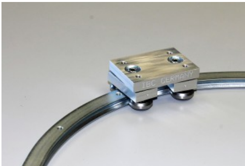
IBC FLEXY-Runner Kurvenführung

Die IBC Wälzlager GmbH hat ihr umfangreiches und vielfältiges Linearwälzlager- und Teleskopführungs-Programm für Anwendungen in der Railway-Technologie weiter an die Anwendungen der Kunden angepasst und ausgebaut. Im Lieferprogramm stehen jetzt neue Systeme für Türöffnungen, Trittsteige, Batterieauszüge, Elektronikschränke und Interieur-Teile zur Verfügung. Dazu zählen beispielsweise Laufwagen in anwenderspezifischem Design. Sie finden Einsatz in Türöffnungssystemen oder in mehreren Positionen verrastbaren Teleskopauszügen für Elektronikeinheiten, die für Servicezwecke verschieden tief ausziehbar sein müssen. Ferner bietet IBC teilbare Teleskopauszüge für Anwendungen in schwer zugänglichen Einhausungen an, die alle sicherheitstechnischen Anforderungen erfüllen. Zu den herausragenden Merkmalen der Linearwälzlager- und Teleskopführungen gehören ihre lange Lebensdauer, ihre anwenderfreundliche Handhabung sowie ihre Wirtschaftlichkeit.