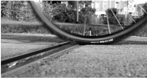
Velosicheres Gleis verhindert Unfälle

Straßenbahnschienen sind ein Problem für Radfahrer. Um die Sturzgefahr zu verringern, hat Dätwyler ein velosicheres Gleis entwickelt, bei dem das Verklemmen des Rades in der Schienenrinne unmöglich wird. Auch Fußgänger profitieren von diesem System, da ein Umknicken verhindert wird. Dies erreicht Dätwyler mit einem in die Schienenrinne geschraubten Sicherheitsprofil. Eine Spurführungsplatte schränkt die Sinusfahrt des Schienenrades ein, erhöht dadurch die Lebensdauer des Gummiprofiles. Die gesamte Konstruktion lässt sich jederzeit und ohne großen Arbeitsaufwand ausbauen, um z. B. Schienenarbeiten durchzuführen. Damit Schmutzpartikel die Rinne nicht verschließen, besitzt sie einen Entwässerungsablauf und lässt sich komplett ausspülen. Mit der neu entwickelten RAILRESTORE stellt Dätwyler eine weitere Neuheit vor. Damit lassen sich Schienenbrüche in kürzester Zeit auf höchstmöglichstem Niveau beseitigen.